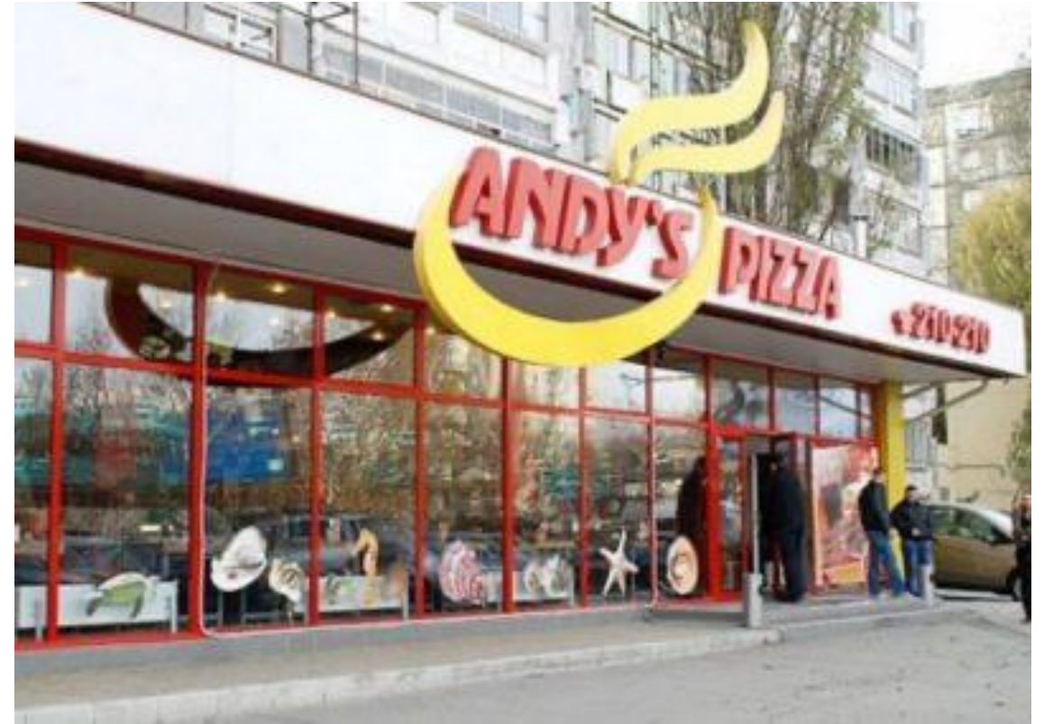
6 min lopen vanaf hotel