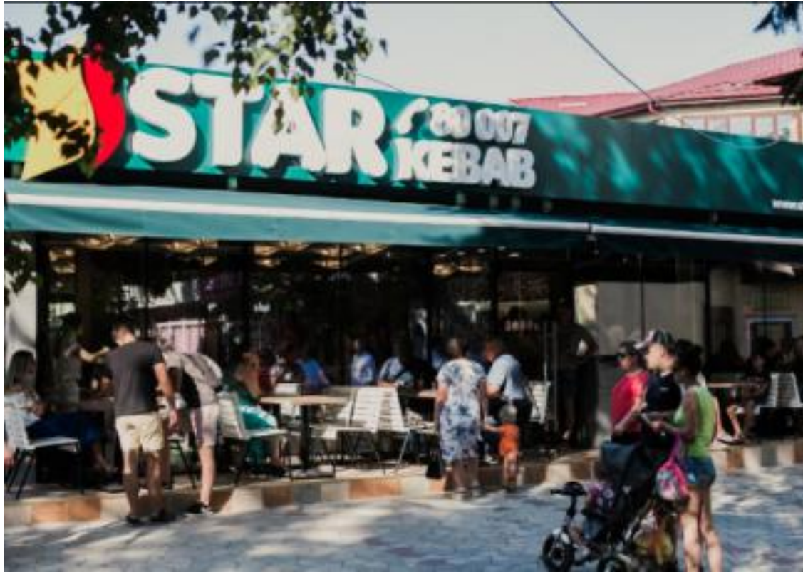
4 min lopen vanaf hotel